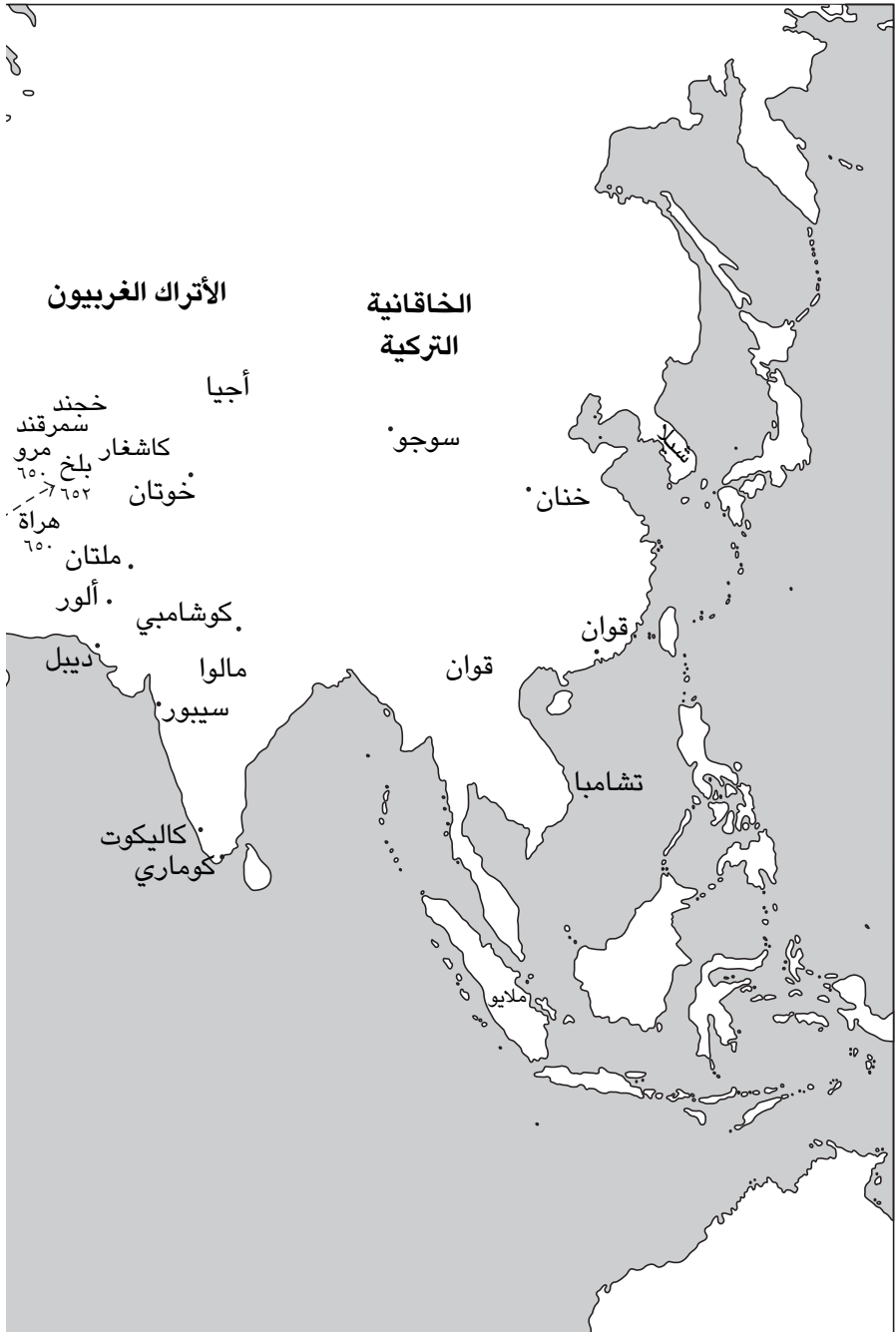
شكل ١-١: الفتوحات الإسلامية الأولى.