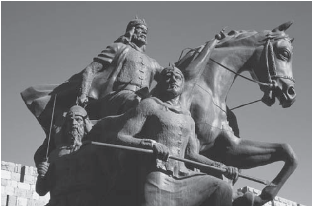
شكل ٧-٢: تمثال صلاح الدين (دمشق، سوريا). 2