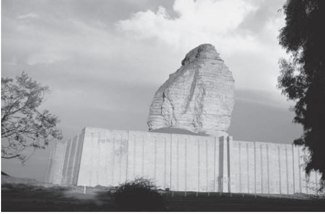
شكل ٣-٥: زقورة عقرقوف (دور كريكالزو، العراق). بُنيت الزقورة على يد الكيشيين (١١٥٥-١٥٣١ قبل الميلاد) وأعيدت جزئياً إلى الحكومة العراقية في السبعينيات من القرن العشرين. 5