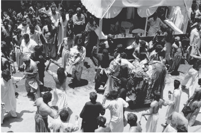
شكل ٦-١: التعزية (كراتشي، باكستان). يمثل الحصان جواد الحسين. 1

العمليات الاستشهادية أو «المهام الانتحارية» محرّمة نظريًا في الإسلام السني. معروف أن من يموتون أثناء الجهاد شهداء، لكن تؤكد المصادر القديمة حرمة شروع المرء في القتال عازمًا على الموت أثناءه (ويُستشهد في هذا الصدد بالآية رقم ٢٩ من سورة النساء).