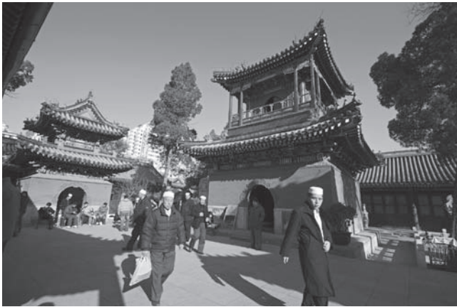
شكل ٣-٢: المسلمون في مسجد نيوجيه (بكين، الصين). 2