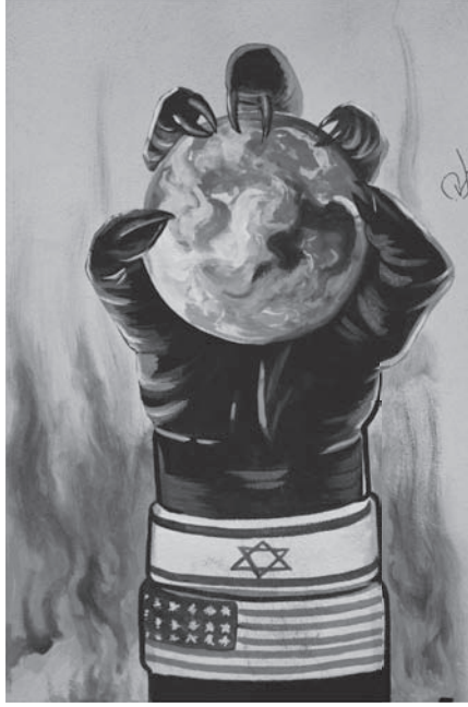
شكل ١-٢: جدارية على السفارة الأمريكية السابقة في طهران بإيران تشير إلى وجود مؤامرة أمريكية-إسرائيلية-شيطانية للسيطرة على العالم. 1

بعض هذه النظريات أقل غرابةً من البعض الآخر؛ فجهاز المخابرات الأمريكية أدار انقلاب عام ١٩٥٣ الذي أطاح بالحكومة الإيرانية، لكن من المنافي للعقل القول إن آية الله الخميني كان عميلاً بريطانياً أو أمريكياً، أو أن اليهود والماسونيين تأمروا منذ البداية لنشر الهلينية (!) على حساب إيران. ومما لا شك فيه أنه كان لإيران والفرس تأثير تشكيلي على حدود الحضارة الإسلامية ومضمونها، غير أنهم - في نواحٍ عدة - ما كانوا ليستطيعوا تحقيق هذا دون مساعدة الأتراك.