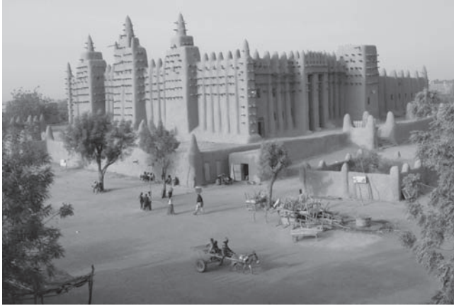
شكل ٣-١: مسجد في غرب أفريقيا (جينييه، مالي). 1