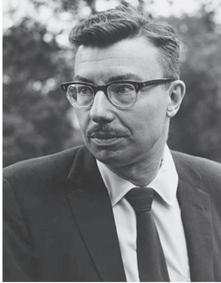
شكل ٥-١: مارشال هودجسون. 1

الإسلامي والحضارة الإسلامية، وعن المنهجية التي ينبغي للمؤرخين دراستهما بها. ومع أن كتابه هو ملخص رفيع للموروث الاستشراقي بأكمله، فهو من عدة جوانب أيضًا محاولة لتحديد أوجه ضعف هذا الموروث وتصحيحها. وبينما كان كتاب «الاستشراق» نقدًا للموروث من الخارج، فإن «مغامرة الإسلام» نقد له من الداخل.