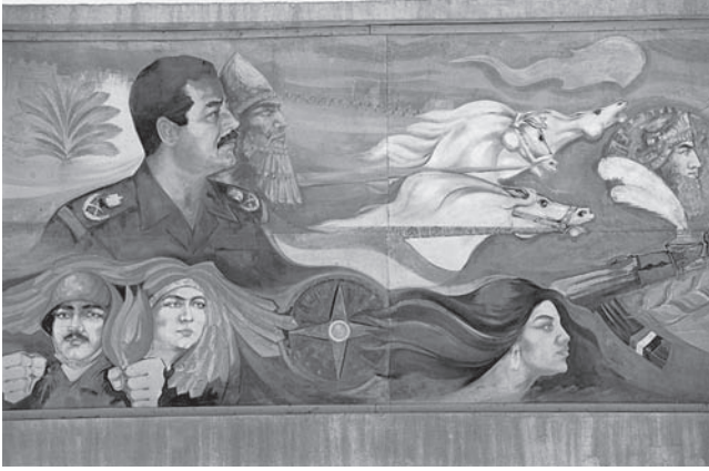
شكل ٧-١: صدام حسين ونبوخذ نصر (الذي حكم البلاد من عام ٦٠٥ حتى عام ٥٦٢ قبل الميلاد). 1

علاوة على ذلك، شبّه صدام نفسه علانيةً بكلّ من صلاح الدين ونبوخذ نصر (بختنصر)؛ إذ كان الأول من تكريت (شمال بغداد) واشتهر بطرده الصليبيين من الأرض المقدسة، والثاني كان حاكمًا للعراق (أو بلاد بابل) واشتهر بطرده اليهود من الأرض المقدسة في الأزمان القديمة. كان غرض صدام واضحًا: فهو الحاكم الذي سيقدم المساعدة للمسلمين في فلسطين عن طريق هزيمة اليهود، ومن ثم إعادة الأرض إلى الحكم الإسلامي. وهكذا أصبح «اليهود» من جانبهم نظراء «الصليبيين» في الخطابات السياسية، والنقاشات العامة، وحتى كتب الأطفال المدرسية في أجزاء من العالم الإسلامي. ولذا، شبّه الحصار الإسرائيلي لبيروت عام ١٩٨٢ في وسائل الإعلام المحلية بحصار الصليبيين لعكا في الفترة ١١٨٩-١١٩١؛ وفي هذا المثال (الذي ليس سوى مثال واحد من بين عدة أمثلة) لا يقتصر الأمر على أن المسلمين عقدوا مقارنة واضحة وسطحية بين الغزاة المعاصرين لفلسطين وغزاة العصور الوسطى، لكن ما حدث أن واقعة ملتبسة نسبيًا من تاريخ العصور الوسطى قد استشهد بها عرضًا واعتُبرت جلية بوجه عام. والانشغال التام للغرب حاليًا بالصراع الفلسطيني الإسرائيلي (الذي يتجاهل في الأغلب صراعات أخرى أكثر عنفًا أو تكلفةً) هو اعتراف من الدرجة الأولى بأهمية القضية لدى المسلمين.