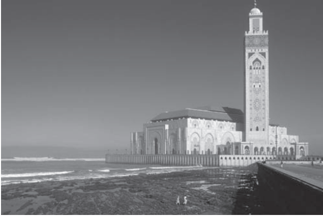
شكل ٣-٣: مسجد الحسن الثاني (الدار البيضاء، المغرب). 3

لا غرو أن أكبر مسجد في العالم هو المسجد الحرام الذي بُني حول الكعبة في مكة التي يتوافد إليها ملايين الحجاج كل عام. وعلى نحو غير متوقع إلى حد ما، يُقال إن ثاني أكبر المساجد هو مسجد الحسن الثاني في الدار البيضاء بالمغرب. المسجد الذي تم بناؤه على مدار سبع سنوات (١٩٨٦-١٩٩٣) على يد أكثر من ٦٠٠٠ شخص (عادةً ما كانوا يعملون ليل نهار) يتسع لعدد ٢٥٠٠٠ شخص، وبه أطول مئذنة في العالم (نحو ٢١٣ متراً). إنه مبنى مذهل بكل المقاييس؛ حيث الأرضية الزجاجية (المبنية جزئياً فوق سطح الماء)، والسقف المنزلق الأوتوماتيكي، وأشعة الليزر التي تشير إلى مكة أثناء الصلوات الليلية، والأرضيات الرخامية الدافئة، والأبواب الكهربائية، والأسقف المزينة بالرسوم والنقوش، وأعمدة الجرانيت الأبيض، والثريات الزجاجية المستوردة من إيطاليا. ما لا يقل إثارة للدهشة عما سبق حقيقة أن الشعب المغربي (حتى الفقراء منه) تحملوا بالكامل تكلفة بناء هذا المسجد التي بلغت ٨٠٠ مليون دولار.