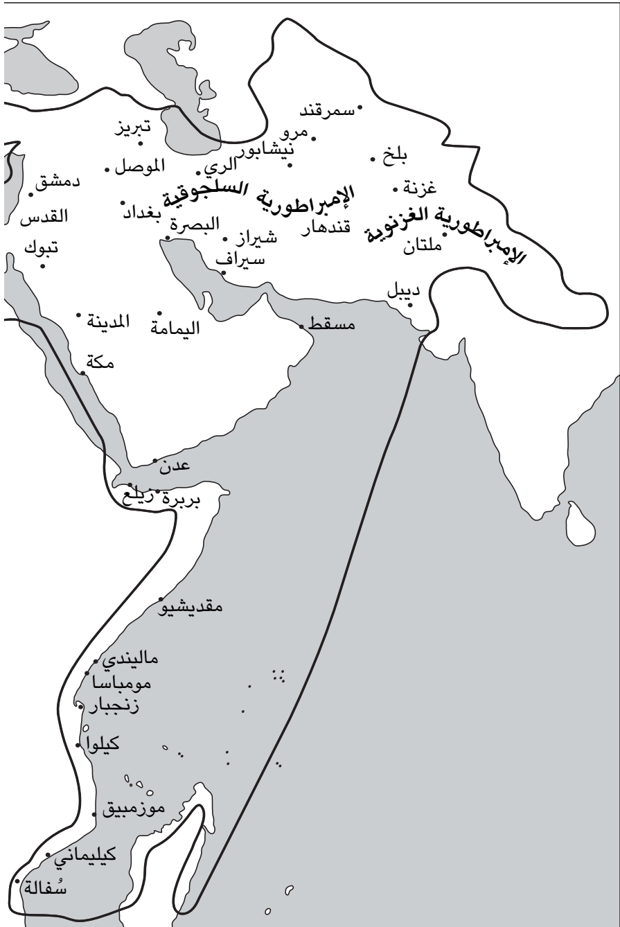
شكل ١-٣: العالم الإسلامي نحو عام ١١٠٠.