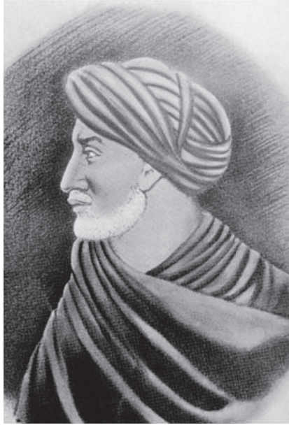
شكل ٥-٢: ابن خلدون. 2

الأوسط» الذي يضع أوروبا في مركز العالم أصبح «المنطقة الممتدة من النيل إلى نهر أوكسوس»، و«الثورة الصناعية» أصبحت «التحول الغربي العظيم». وصحيح أن حلوله قد تكون غير متقنة وتصنيفاته مبهمة، لكن وكما يشير العنوان الفرعي للكتاب، كان الضمير والدقة (وليس التنميق) القوتين الموجهتين لمنهج هودجسون تجاه التاريخ الإسلامي. ومع أن التدقيق الإملائي المتاح على أجهزة الكمبيوتر يرفض كل تعبيراته الجديدة، كان الباحثون أكثر تقبلاً لبعضها مثل مصطلح «إسلاماتية» في الإشارة لا إلى الإسلام بوصفه ديناً بل إلى «العقدة الثقافية والاجتماعية المرتبطة تاريخياً بالإسلام والمسلمين».