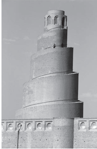
شكل ٣-٤: المئذنة الملوية بالمسجد الكبير في سامراء (العراق). 4

دومًا للسياقات المحلية، ودمجوا سمات المجتمعات السابقة داخل مجتمعاتهم، فأوجدوا في كثير من الأحيان مزيجًا فريدًا في نوعه بين الأنماط القديمة والحديثة. بصورة ما، يعد الإسلام أول حضارة «خضراء» (لكن لا بد من الاعتراف أن هذا قد حدث عن غير قصد) بما له من تاريخ طويل من إعادة تدوير المواد الأقدم واستخدام المنتجات والموروثات المحلية في الغالب. وهذا ليس سبب قراءة الهيبيين لشعر الرومي، لكنه لن يضر بالطبع.