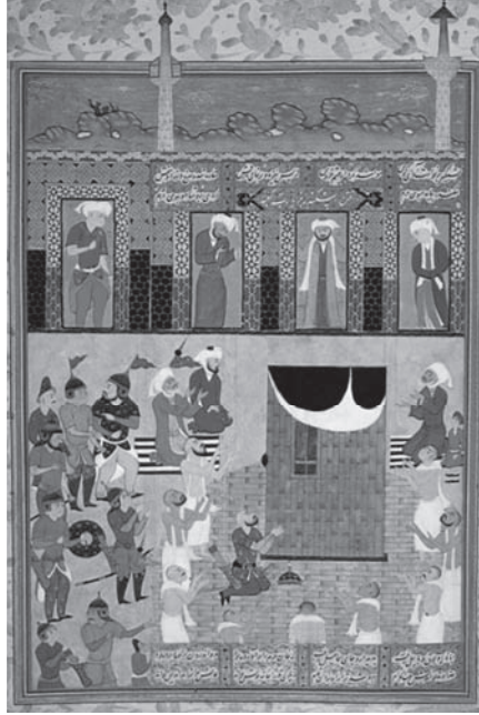
شكل ١: الإسكندر الأكبر يزور الكعبة في مكة. 1

بدءًا من القرن السابع فصاعدًا هو ذلك الذي كان فيه الإسلام قوة مهيمنة سياسيًا أو دينيًا أو ثقافيًا.