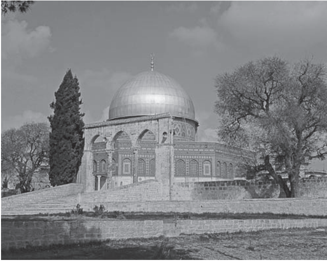
شكل ١-٢: قبة الصخرة في القدس. تضم النقوش المحفورة على قناطر المبنى مئمة الأضلاع آيات قرآنية تتحدى بعض العقائد الأساسية للديانة المسيحية. 1

استثناء واحد أو اثنين) كان الخلفاء سببًا في إثناء الشعوب المفتوحة بلاهما عن الدخول في الإسلام، وهو ما يعني أمرين: أن عددًا كبيرًا من الأشخاص كانوا يمقتونهم (وهم غير المسلمين المطالبين بدفع ضرائب أكثر)، وأن أغلب رعايا الخلفاء كانوا من غير المسلمين. بذا كان لدى المسلمين العرب، والمسلمين غير العرب، وغير المسلمين العرب، وغير المسلمين غير العرب سببًا لمعارضة الخلفاء في دمشق. وفي عام ٧٥٠ أطاحت ثورة شيعية من الشرق بالأمويين، ووصلت بالأسرة العباسية إلى الحكم.