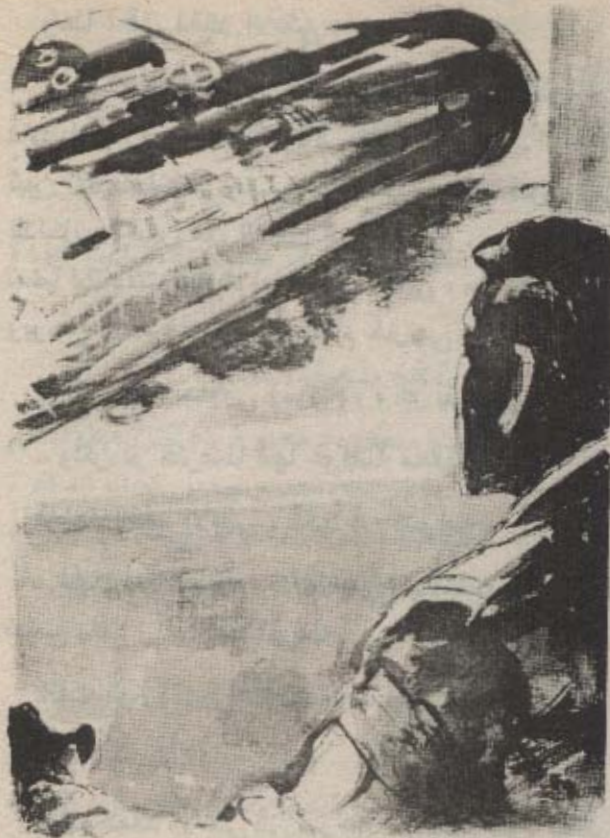
عرضت الشاشة صورة حادة الألوان، بين الأخضر والأحمر والأزرق، ترسم حدود الغواصة (ب. ن - ١٠٣)، الرابضة في الأعماق.