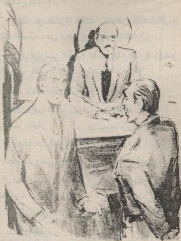
انعقد حاجبا الرئيس ، فى حين تسأل (أمجد) فى حذر «نور» - وماذا عن الباقيين ؟