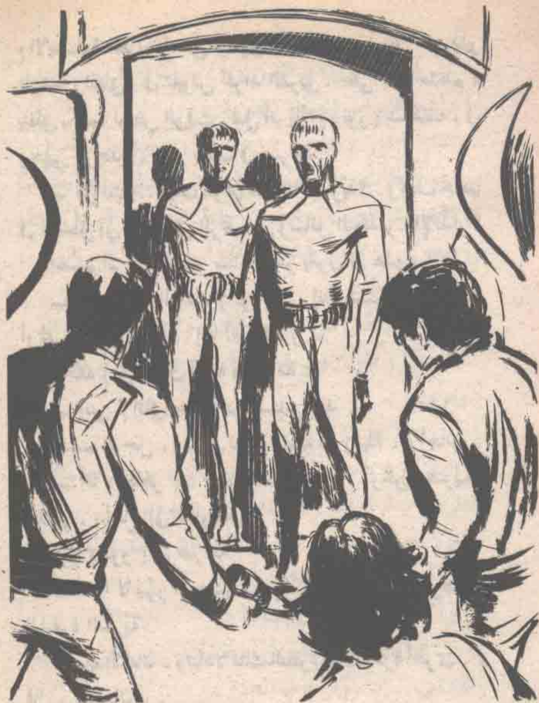
التفت الجميع إلى مصدر الصوت في حركة حادة ، وأسرع ( نور ) ينتزع مسدسه الليزرى ، ويصوبه إلى الرجلين ..

قاطعها ( نور ) في حزم : - ليس هذا بالاحتمال المُستبعد يا ( سلوى ) ، وهذا يدفعنا إلى ضرورة التحرك في سرعة ، ومحاولة حماية أنفسنا ، وفهم ما يدور حولنا ، قبل أن نخسر المعركة . هب ( رمزي ) و ( محمود ) من مقعديهما ، وهتف الأول في صرامة :