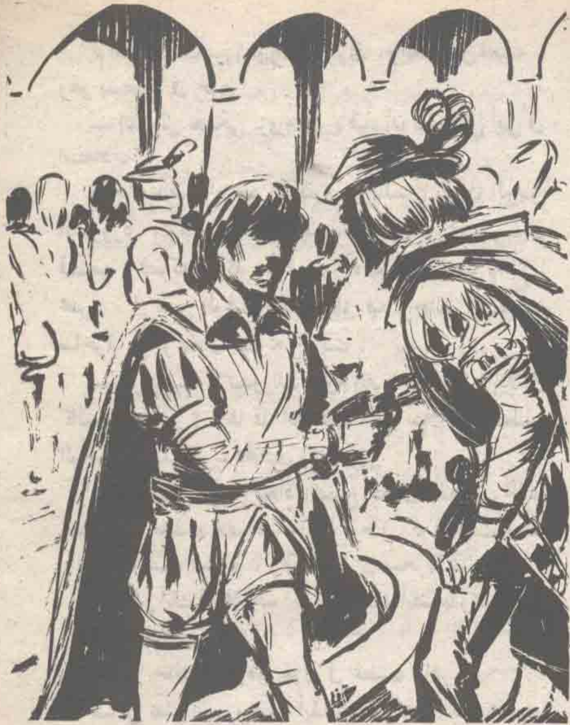
وفجأة انتزع ( نور ) مسدسه الليزرى ، وألصق فوهته بمعدة ( خالد ) ، وهو يكرّر سؤاله فى مزيج من الغضب والصرامة ..

ازداد انعقاد حاجبي ( نور ) ، وهو يقول فى صرامة :