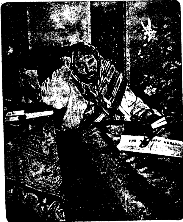
وهذه صورة السيد بعد العملية الجراحية

وقد بالغ الشيخ أبو الهدى في عداوته والكيد له حتى كان يسعى في ايذاء من يذكره ببحر أينما كان من بلاد الدولة . وكان يطعن في نسبه ودينه كما هي عادته فيمن يستاء منهم فانه يجردهم من اللباس الذي فصله وخطه لنفسه ولم يرضى عنهم من انصاره . وقد كتب إليّ في ٢٩ رجب سنة ١٣١٦ كتابا قال فيه « اني أرى جريدتك طاغية بشقاشق المتأفغن جمال الدين الملققة وقد تدرجت به الى الحسينية التي كان يزعمها زورا وقد ثبت في دوائر الدولة رسما انه ما زلت اني من اجلاف الشيعة .. وهو مارق من الدين كما مرق السهم من الرمية » وكذلك قال الشيخ أبو الهدى في امام الصوفية الشيخ عبد القادر الجيلي الذي هو من أشهر الشرفاء ، في كتب لفقها باسماء الاموات والاحياء ، ولا ندرى في أيّ دوائر الدولة يسجل شتم الناس فنصدق خبر أبي الهدى كذلك كان شأنه في الاستانة في آخر أيامه بمساعي أبي الهدى الى ان توفاه الله اليه