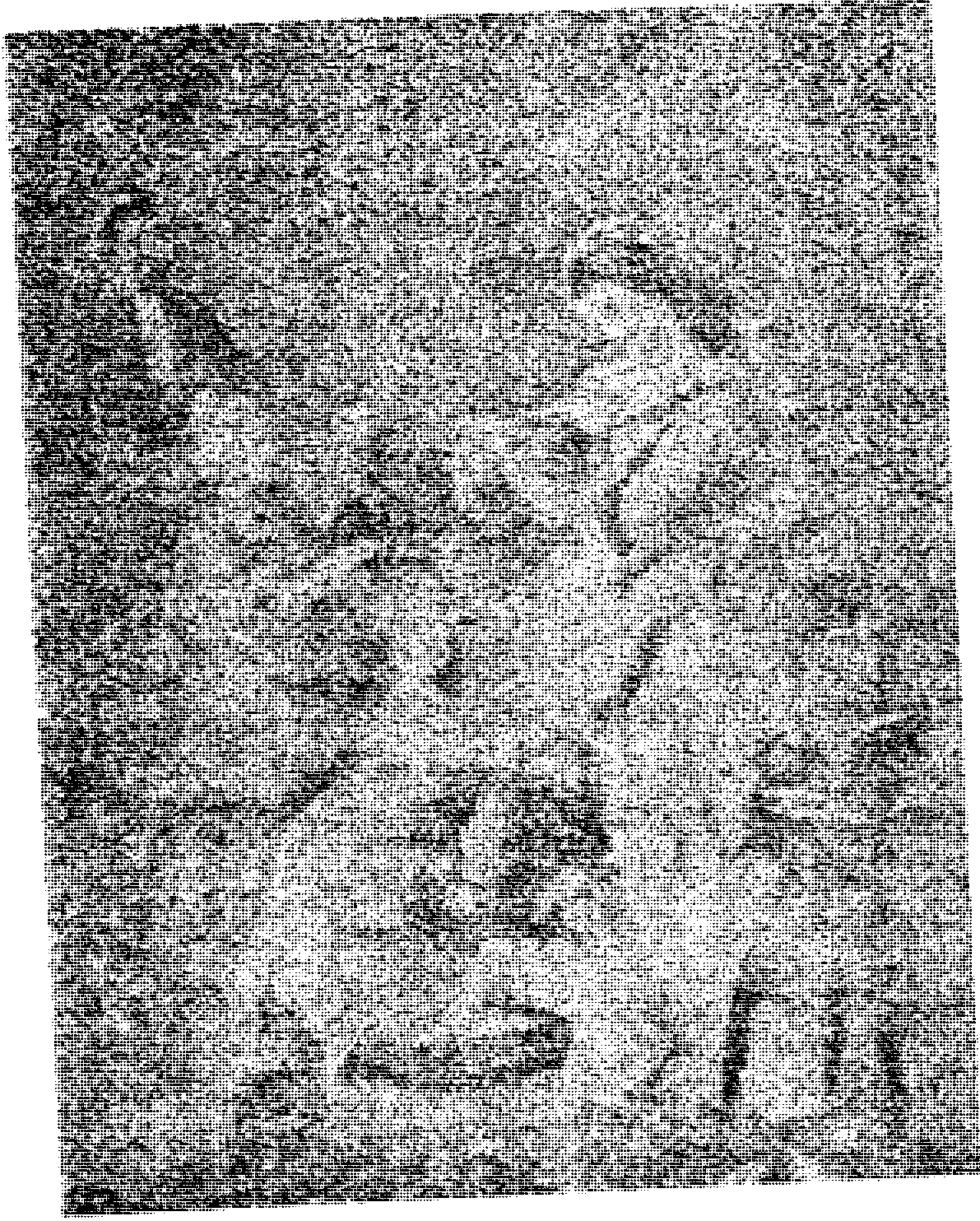
شرلوت توزع الخبز على اخوتها (رسم كلباخ)