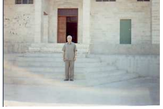
المؤلف أمام مقام الأمام زين العابدين علي بن الحسين 1994

الاهتمام بالامام علي بن الحسين ( زين العابدين ) ، ويقوم الشبك احتفالاتهم الدينية في الأعياد امام هذا المرقد حيث يتم التجمع عنده وتقام الدبكات الشعبية .