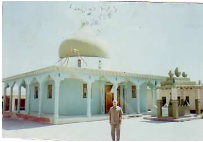
المؤلف أمام مقام الأمام علي بن موسى الرضا 1994

2- مقام الأمام علي بن موسى الرضا وكنيته ابو الحسن ويقع في قرية تيس خراب ، ويعتبر الأمام الرضا الأمام الثامن لدى الشيعة الأمامية ، ولد في العام 148 هـ ، وتوفي مسموماً في طوس ( مشهد ) عام 203 هـ ، وهو من اجلاء اهل البيت وعلمائهم ، وكان المأمون قد عهد اليه بالخلافة من بعده وزوجه ابنته وضرب اسمه على الدينار ، وضمن باحة المقام توجد مغارة طويلة مضاءة بالكهرباء والشموع منحوتة داخل الصخر ، يقوم الناس بزيارتها والتبرك بها ، بالإضافة الى وجود مقام رمزي محاط بشباك من الحديد ، والبناء كبير وواسع يقع الى الشرق من مدينة تيس خراب .