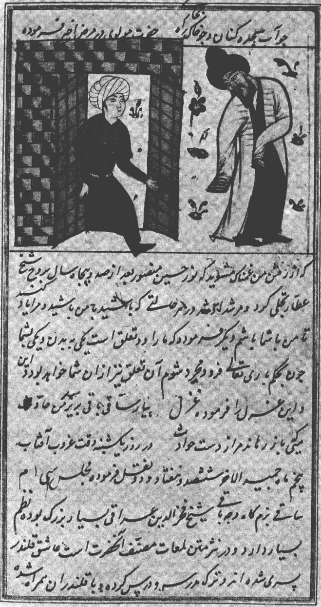
مولانا الرومِيّ يدور أمام دكان صلاح الدين زركوب.

من مخطوط " مجالس العشاق " لسلطان حسين نيقرا، من القرن السابع عشر أو أوائل الثامن عشر