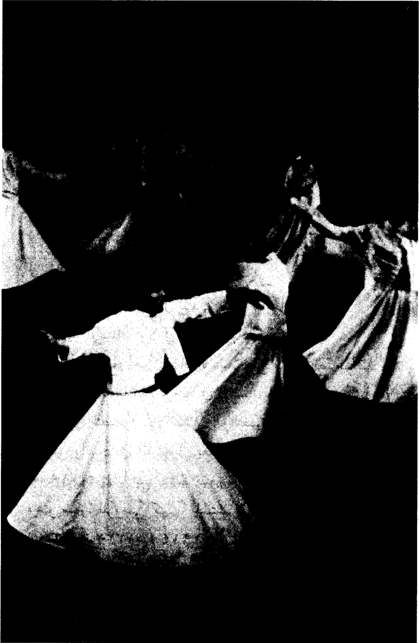
رقص المولوية (الذرايش المتأرون)