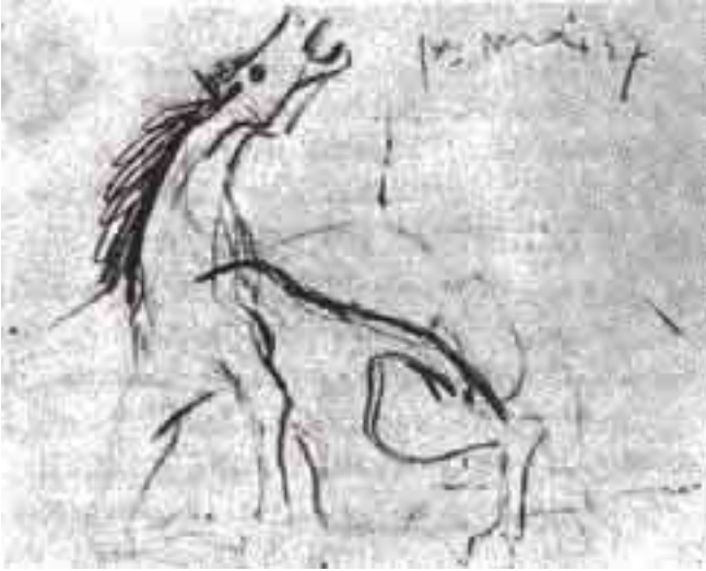
دراسة للحصان في لوحة «الجورنيكا» (أول مايو 1937)

بعينيه الزائغتين، وفتحتي منخاره المتسعيتين، ولسانه الذي يشبه رأس خنجر مدبب داخل شذقيه الفاغرين، ويقوم كل هذا كنقيض لأرضية سوداء تماما مرسومة بالزيت.