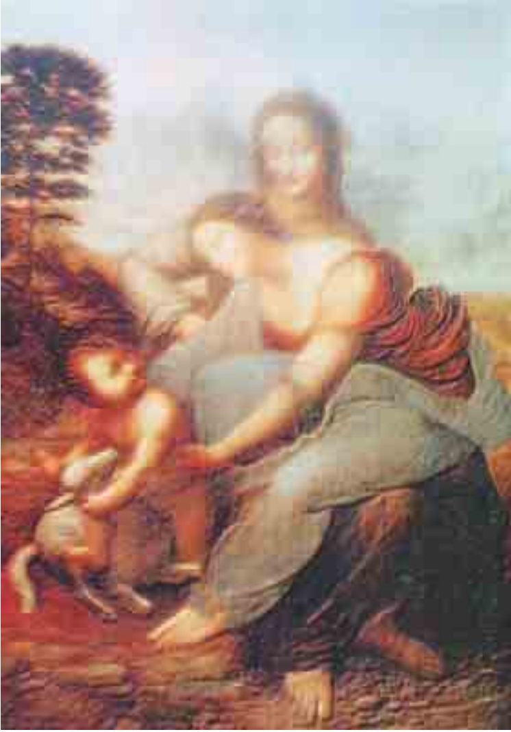
تفصيل من لوحة: القديسة آن والعذراء والطفل