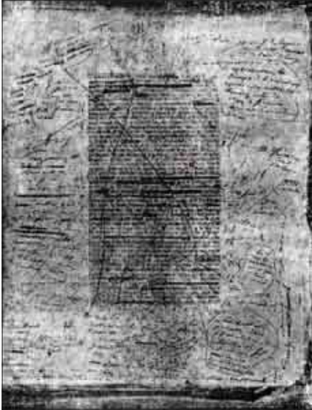
تجربة صفحة من مخطوط بلزك وأهداها إلى النحات دافيد دانجيه منييلة بهذه العبارة: «ليس النحت مقصورا على النحات»

ديسمبر من عام 1935. ويهمننا في هذا السياق أن نعرض لما يقوله عن لحظة الإلهام (*) ، وما سبقها من جهد شديد في مرحل الإعداد التي تميزت بعدم رضائه عما كتب وتمزيقه له عدة مرات. ثم وصل أخيرا بعد فترة من الكمون إلى المرحلة الأخيرة من عملية الإبداع التي، يصفها بأسلوبه الرائع فيقول: «.. ومر نحو أسبوع وأنا لا أجد إلى هدوء نفسي منفضا» وأخذت ديوان أبي الطيب (المتبى) مرة خامسة أقرؤه لا أنتوقف ولا أمل ولا أهدأ.