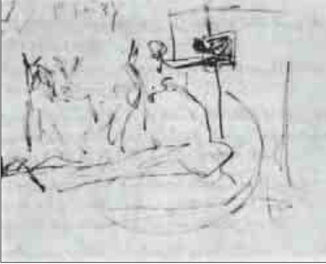
دراسة لأول تكوين للجورنيكا (أول مايو 1937)

عن حالة الفنان، ولكنها معبرة بشكل أكبر عن حال العالم.» ويقوم أرنيهم بعد هذا بتقديم الاسكتشات والصور التي استطاع أن يحصل عليها لمراحل عملية رسم الجورنيكا، ويحاول دراسة ما ورد في كل منها مركزا على ما يأتي: