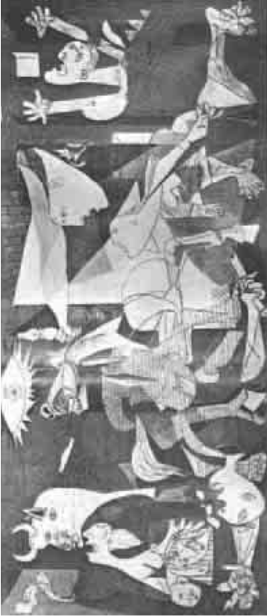
(الجورنيكا في شكلها الأخير الذي عرضت به في معرض باريس الدولي)