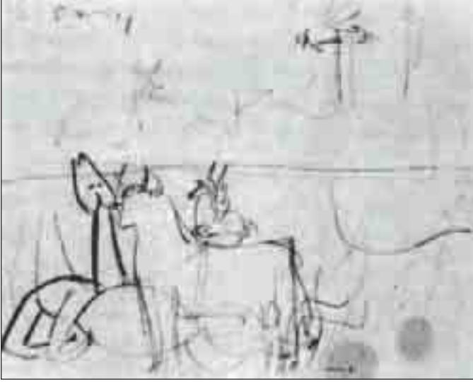
الدراسة الثانية لتكوين الجورنيكا (أول مايو 1937)

له من دلالة في عملية الإبداع. وحين نبدأ في تتبع هذه اللوحة الشهرة مع أرنهيم نجد أن بيكاسو قد بدأ في رسمها اعتباراً من أول مايو سنة 1937 أي قبل أسبوع واحد على مهاجمة طائرات هتلر الحربية للمدينة. والآن نقرب أكثر من الصورة ولنبدأ بالرسم الأول الذي يقدمه لنا أرنهيم، وهو مؤرخ في 1937/5/1 ومرقم بالرقم 1 وقد كانت هذه عادة بيكاسو الذي كان يحرص على تاريخ وترقيم معظم مخلفاته واسكتشاتة. يرى أرنهيم أن هذا الرسم هو أكثر الرسوم شبيهاً باللوحة الأخيرة وأن لم يكن في نفس درجة الأحكام والدقة ونفس الأبعاد التي تميز الجورنيكا المعروضة. صحيح أنه يحتوي على جميع العناصر الموجودة فيها ولكنها-أي هذه العناصر-باهتة أو مائعة الحدود.