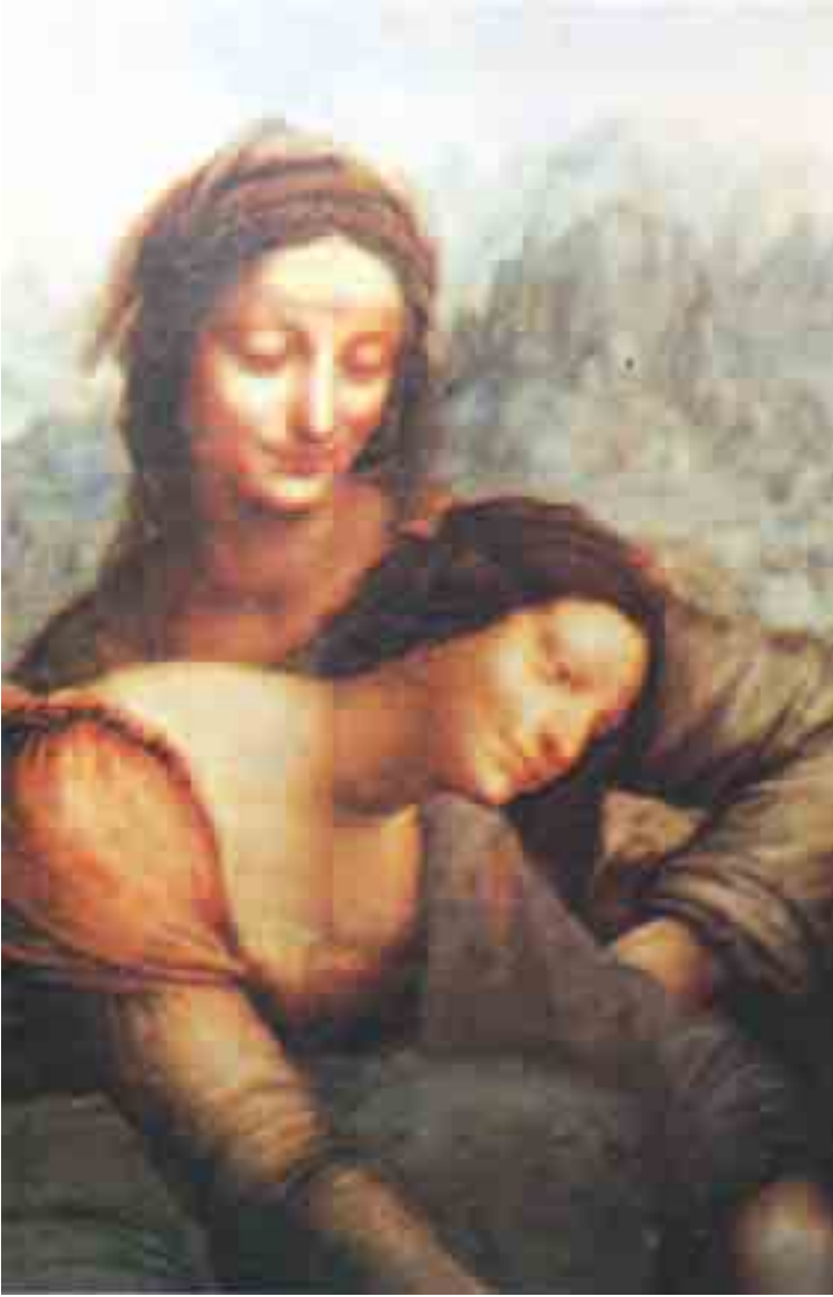
القديسة آن والعذراء والطفل