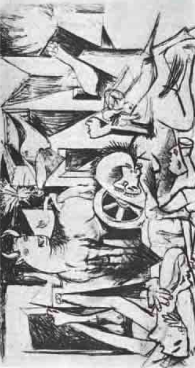
الجورنيكا في المرحلة الثالثة (9 مايو 1937)