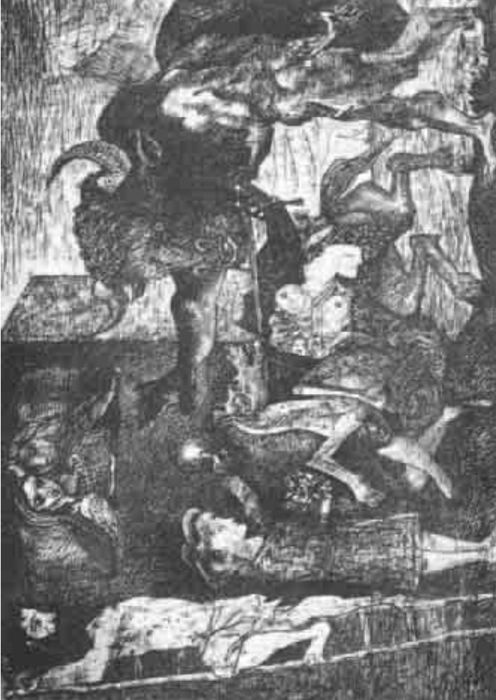
ظهور المينوتور في لوحات بيكاسو قبل الجورنيكا