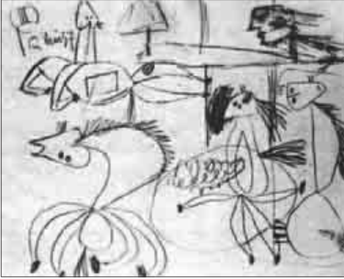
الدراسة الثالثة لتكوين الجورنيكا (أول مايو 1937)

الفنان إلى تصميم لا يمكن وصفه من خلال عملية التخصيب أو الإثراء المتتالي للأجزاء أو القطع ولكنه يتميز بأنه نمو دياكتيكي يتم بتبادل النظر إلى الجزء وإلى الكل في عملية تقدم وتأخر بينهما. وهنا ينبغي علينا ألا نتأمل مجرد الحركة المناسبة للصورة ككل، بل علينا كذلك أن نحصر العلاقة بين الصورة وبين جزئياتها في مختلف المراحل. إن العمل الفني لا يتقدم إلى الأمام على نحو ما يحدث للبذرة أو الكائن الحي، ولكنه ينمو على نحو ما يحدث في حركة التآرجح للأمام وللخلف من الكل للجزء ومن الجزء للكل وهكذا في حركة دياكتيكية مستمرة في التقدم والصعود.