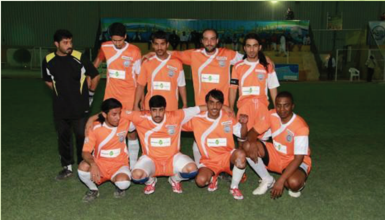
فريق الجوف الفائز بكأس الفريق المثالي