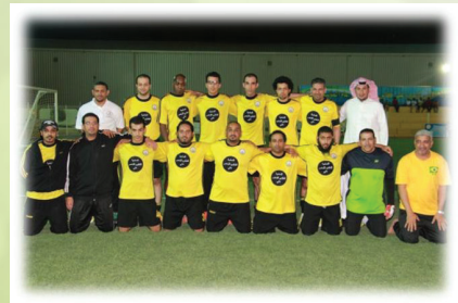
فريق المنطقة الشرقية