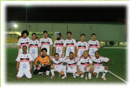
فريق منطقة عسير