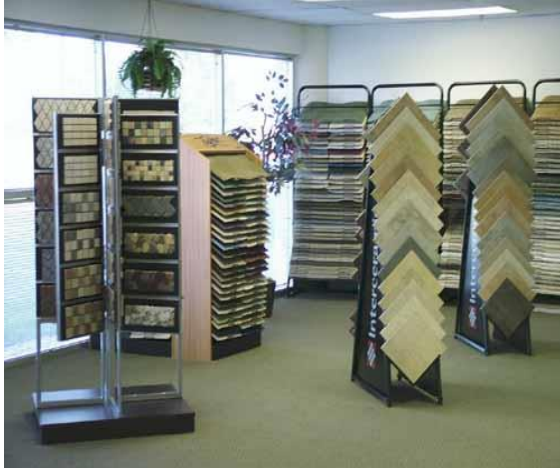
Gạch granite họa tiết Pattern Porcelain Tiles

هو مادة مصنعة تدخل في صناعة الأرضيات بالشكل الخارجي شبيه جدا بالسيراميك لكنه يختلف بالصناعة فالبورسلين يتكون من طبقة واحدة سميكة تقاوم الحرارة والوزن والخدش والاحتكاك غير قابل لامتناس الالوان والبقع كانواع الرخام لمعانه دائم ولا يتطلب الجلي أو التلميع بعد التركيب كما انه من الأنواع الأكثر تحملاً للأوزان، يتوفر بعدة مقاسات وأشكال كثيرة جداً، منها الناعم الأملس بالألوان اللامعة، وهناك الأنواع الخشنة ذات الألوان المطفية، وأخرى بألوان معتقة وعشوائية. البورسلين يخلو من الطينة الفخارية فهو عبارة عن طبقة كاملة من مادة البورسلين شديدة الصلابة وهذا بعكس السيراميك